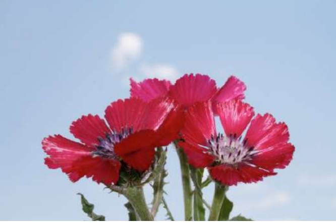
Sevgi çiçeđi ( Centaurea tchihathefii )