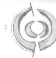
Şekil 1: Yaban Domuzu Erkek Bireyinde