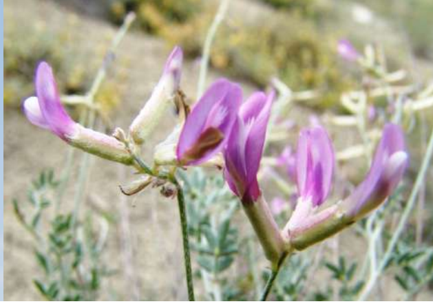
Beypazarı geveni ( Astragalus beypazaricus )